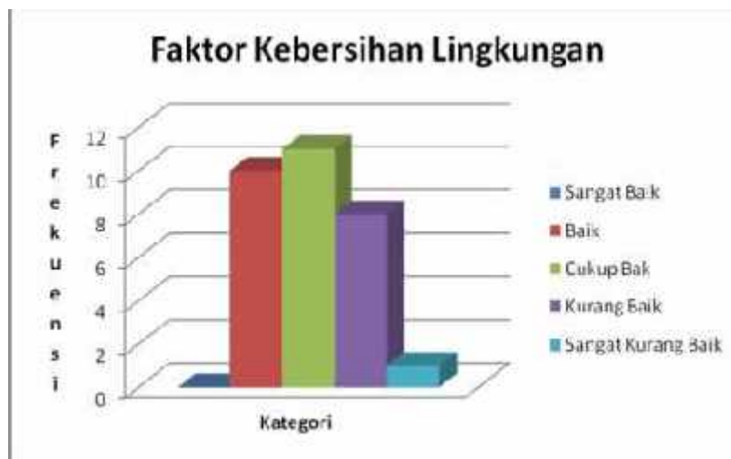
Gambar 5. Histogram Perilaku Hidup Sehat Masyarakat yang Terdampak Banjir Lahar Dingin Gunung Merapi di Kabupaten Magelang Berdasarkan Faktor Kebersihan Lingkungan.

(26,67 %) mempunyai kategori kurang baik, dan 1 orang (3,33 %) mempunyai kategori sangat kurang baik. Berdasarkan nilai mean yaitu 17,47 terletak pada interval 16,27 < X \leq 18,66 . Ini artinya perilaku hidup sehat masyarakat yang terkena dampak lahar dingin merapi di Kabupaten Magelang berdasarkan faktor kebersihan lingkungan adalah berkategori cukup baik. Untuk lebih mudah dipahami, maka disajikan gambaran dalam bentuk histogram perilaku hidup sehat masyarakat yang terdampak banjir lahar dingin merapi di Kabupaten Magelang berdasarkan faktor kebersihan lingkungan sebagai berikut: