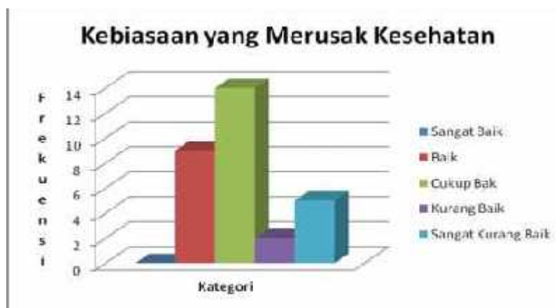
Gambar 7. Histogram Perilaku Hidup Sehat Masyarakat yang Terdampak Lahar Dingin Merapi di Kabupaten Magelang Berdasarkan Faktor Kebiasaan yang Merusak Kesehatan.