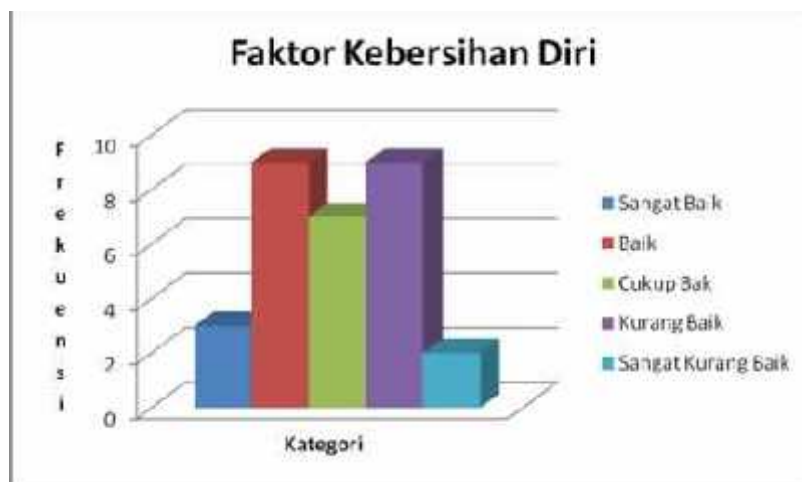
Gambar 4. Histogram Perilaku Hidup Sehat Masyarakat yang Terdampak Banjir Lahar Dingin Gunung Merapi di Kabupaten Magelang Berdasarkan Faktor Kebersihan Diri.

Perilaku hidup sehat masyarakat yang terkena dampak lahar dingin Gunung Merapi di Kabupaten Magelang berdasarkan faktor kebersihan diri di atas dapat dijelaskan bahwa berdasarkan faktor kebersihan diri adalah 3 orang (10,00 %) mempunyai kategori sangat baik, 9 orang (30,00 %) mempunyai kategori baik, 7 orang (23,33 %) mempunyai kategori cukup baik, 9 orang (30,00 %) mempunyai kategori kurang baik, dan 2 orang (6,67 %) mempunyai kategori sangat kurang baik. Berdasarkan nilai mean yaitu 42,43 terletak pada interval 40,28 < X \leq 44,57 . Ini artinya perilaku hidup sehat masyarakat yang terkena dampak lahar dingin Gunung Merapi di Kabupaten Magelang berdasarkan faktor kebersihan diri adalah berkategori cukup baik. Untuk lebih mudah dipahami, maka disajikan gambaran dalam bentuk histogram perilaku hidup sehat masyarakat yang terdampak banjir lahar dingin Gunung Merapi di Kabupaten Magelang berdasarkan faktor kebersihan diri sebagai berikut: