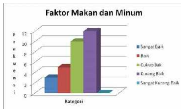
Gambar 3. Histogram Perilaku Hidup Sehat Masyarakat yang Terdampak Banjir Lahar Dingin Merapi di Kabupaten Magelang Berdasarkan Faktor Makan dan Minum

Perilaku hidup sehat masyarakat yang terdampak banjir lahar dingin merapi di Kabupaten Magelang berdasarkan faktor makan dan minum di atas dapat dijelaskan bahwa berdasarkan faktor makan dan minum adalah 3 orang (10,00 %) mempunyai kategori sangat baik, 5 orang (16,67 %) mempunyai kategori baik, 10 orang (33,33 %) mempunyai kategori cukup baik, 12 orang (40,00 %) mempunyai kategori kurang baik, dan 0 orang (0,00 %) mempunyai kategori sangat kurang baik. Berdasarkan frekuensi terbanyak pada interval 28,89 < X \leq 33,14 . Ini artinya perilaku hidup sehat masyarakat yang terdampak banjir lahar dingin merapi di Kabupaten Magelang berdasarkan faktor makan dan minum adalah berkategori kurang baik. Untuk lebih mudah dipahami, maka disajikan gambaran dalam bentuk histogram perilaku hidup sehat masyarakat yang terdampak banjir lahar dingin Gunung Merapi di Kabupaten Magelang berdasarkan faktor makan dan minum sebagai berikut: