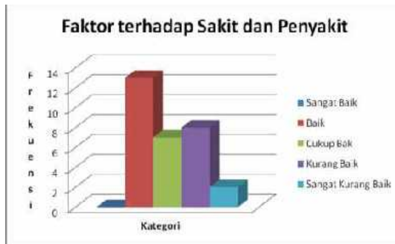
Gambar 6. Histogram Perilaku Hidup Sehat Masyarakat yang Terdampak Banjir Lahar Dingin Gunung Merapi di Kabupaten Magelang Berdasarkan Faktor Terhadap Sakit Dan Penyakit.

faktor terhadap sakit dan penyakit sebagai berikut: